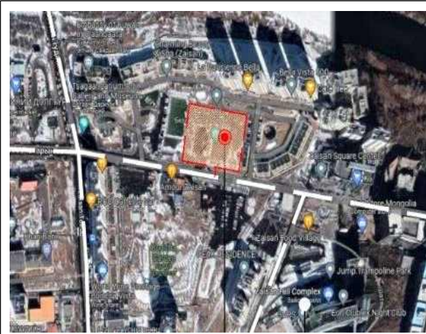
사업부지 주변 시설